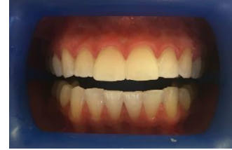
Dantų vaizdas prieš balinimą, dantų izoliacija ir vaizdas iš karto po balinimo.