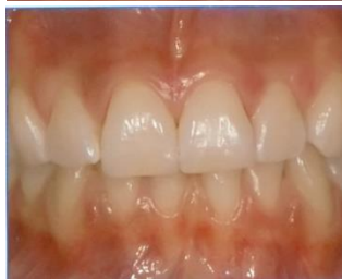
Po vidinio balinimo